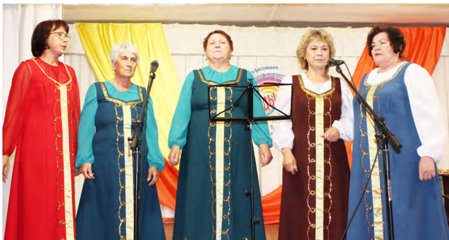
Музыкальный коллектив «Сибиринка» из Раздолинска